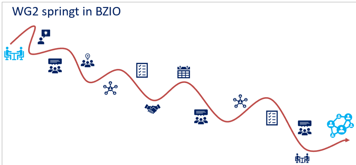
figuur 2: Trajectverloop WG2 Springt

Re-integratie is op heden een hot topic binnen onze maatschappij. Niet enkel de overheid is vragende partij, ook de mensen zelf met een arbeidsbeperking. Hierdoor willen we met onze organisatie inspelen op re-integratie en dit betrekken in het revalidatie traject. Het zou als revalidatie centrum een must moeten zijn om in te zetten op participatie in alle levensdomeinen en niet enkel in te zetten op heropbouw van fysieke capaciteiten. Het bieden van de mogelijkheid tot een actieve deelname in de maatschappij heeft een positieve invloed op de revalidatie. Hiermee komen we niet enkel tegemoet aan de participatienoden van de revalidant, maar ook aan de maatschappelijk relevantie van werk.